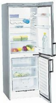
Nejúspornější chladničky a mrazničky (šířka 60 centimetrů, objem do 315 litrů)